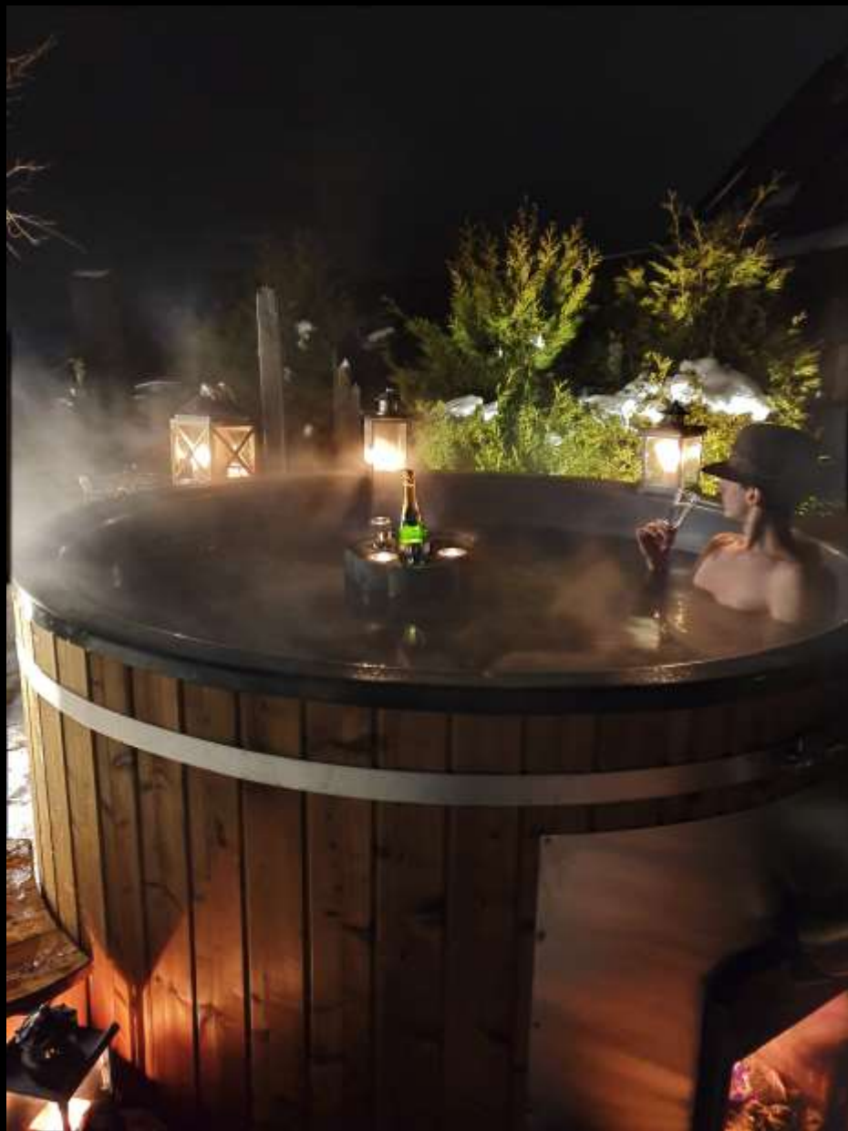
Aromaterapia w balii