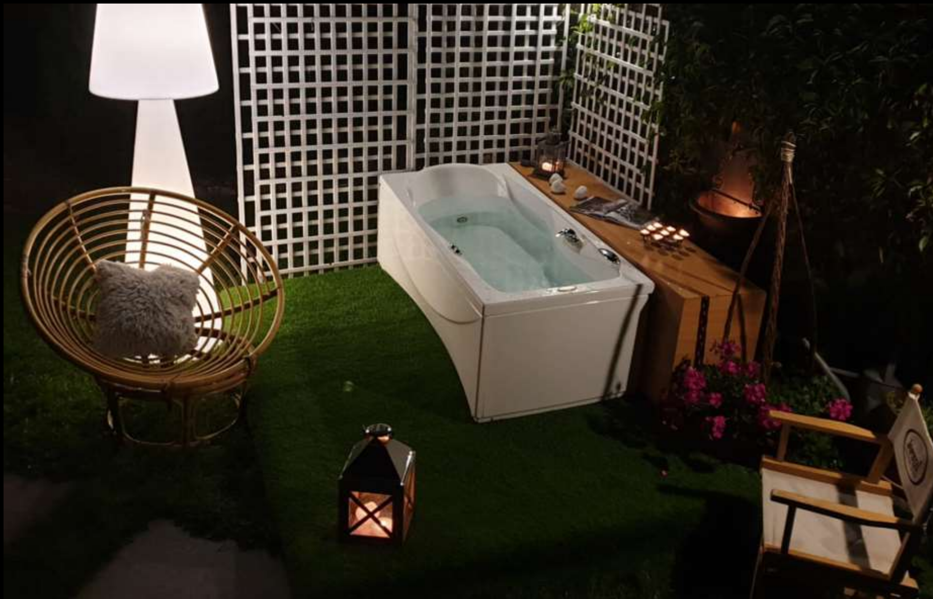
klasyczna jednoosobowa wanna w ogrodzie pod Gwiazdami