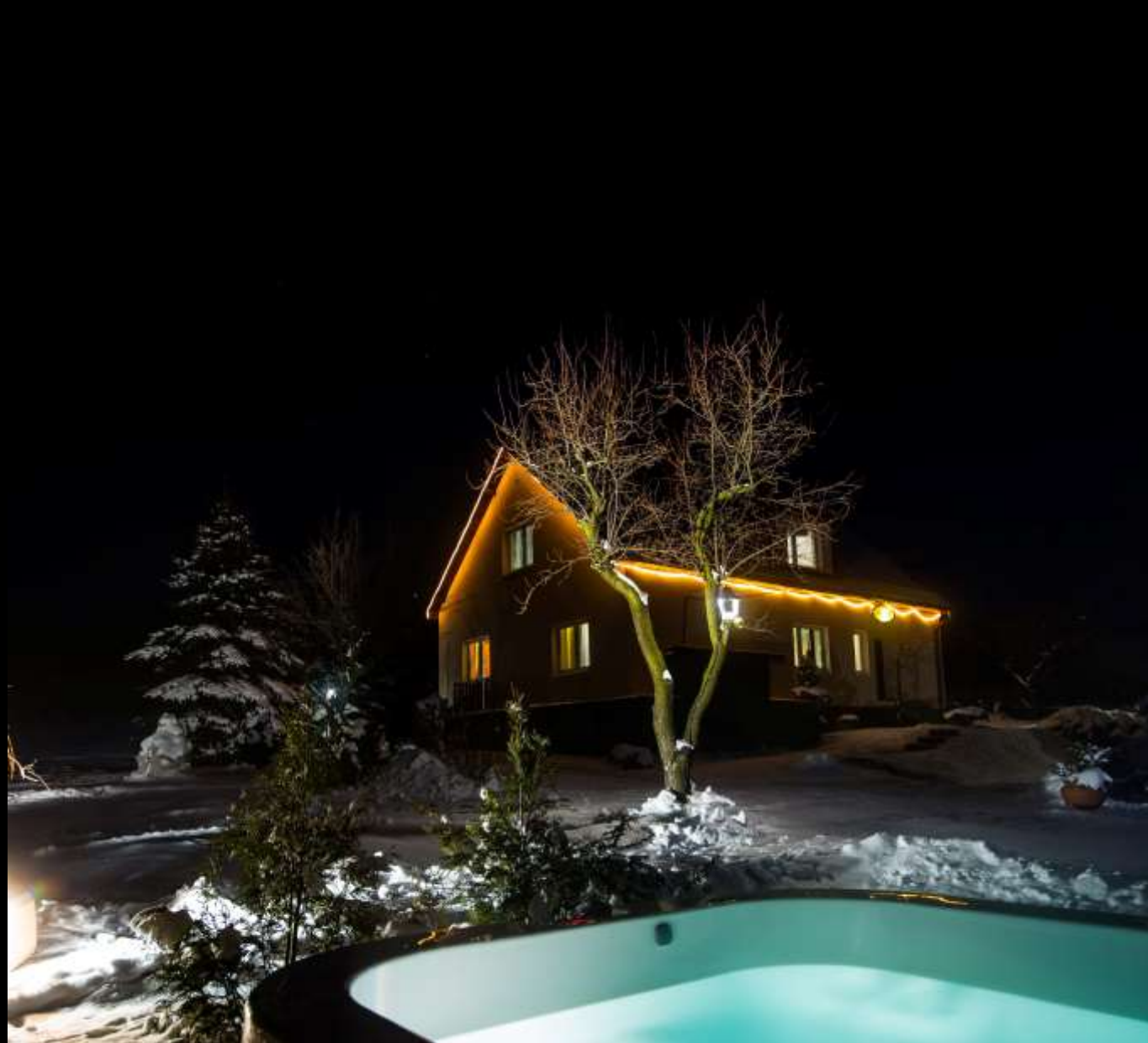
Jacuzzi® podczas mrozu, minus 22 st. C.