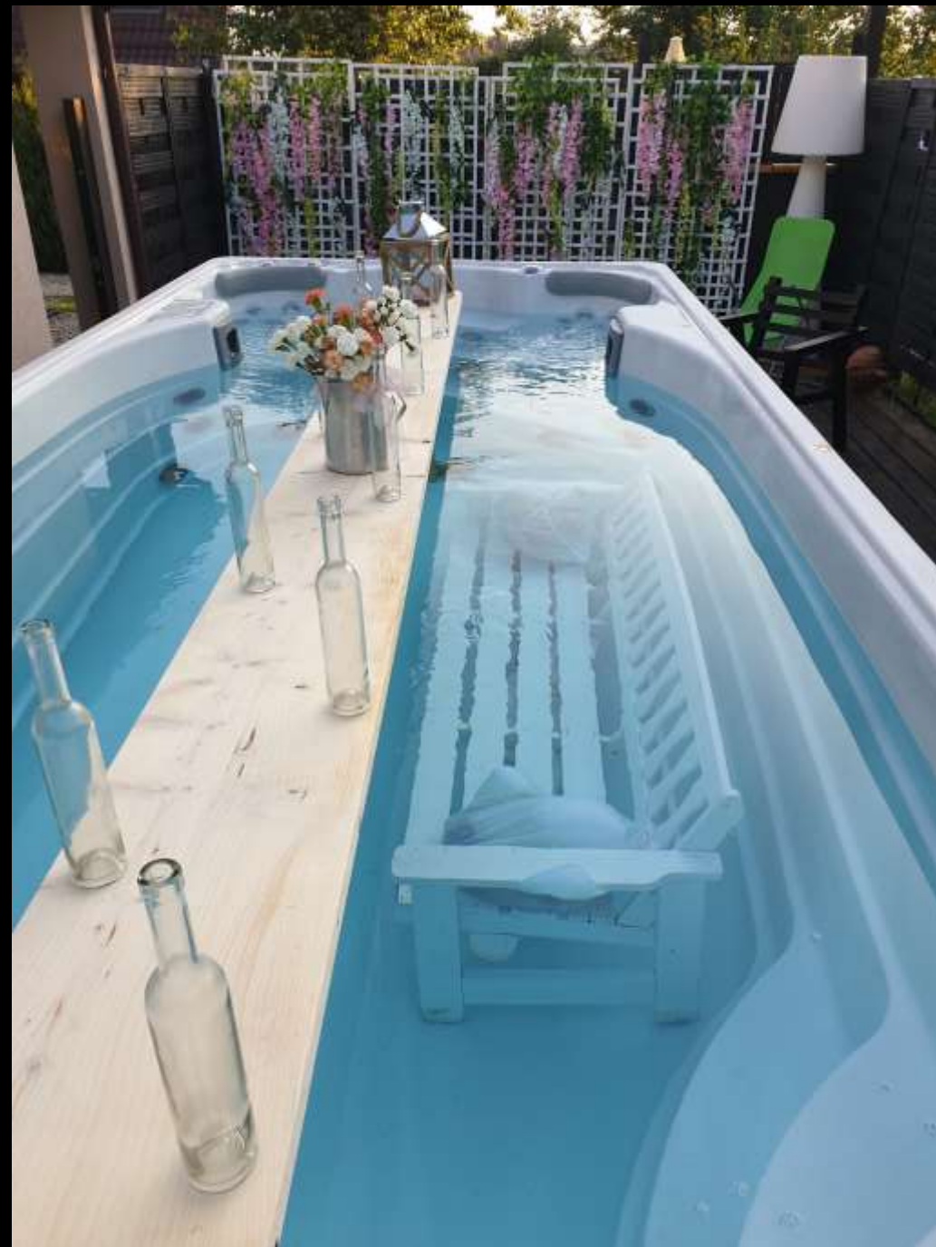
Biesiadowanie w ciepłej wodzie pod Gwiazdami